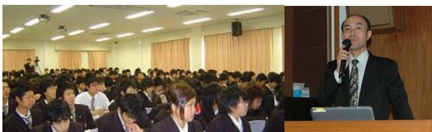
1年生を対象とした原子力に関する講演会